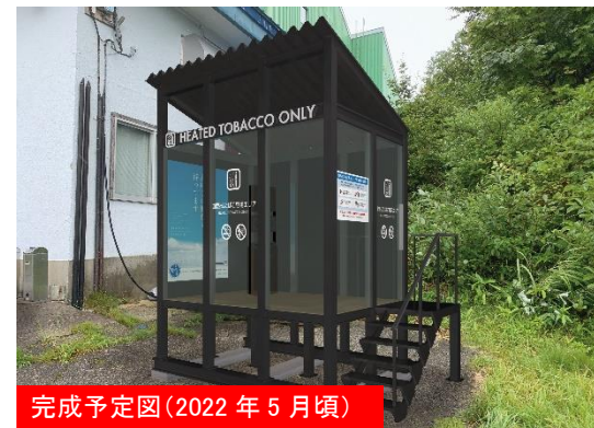
完成予定図(2022年5月頃)